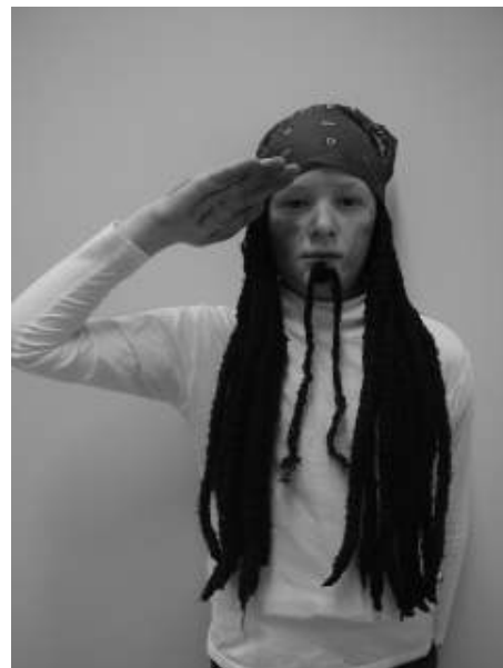
Nimi: Jack Sparrow Vanus: 76 Elukoht: Must Päril Lemmikvärv: must Lemmiksöök: kiirnuudlid Lemmikloom: kaheksajalg Pikkus ja kaal: 180cm ja 80kg