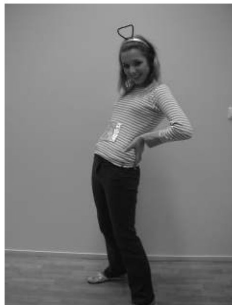
Nimi: Tinky-Vinky Vanus: 99 Elukoht: Teletupsumaa Lemmikvärv: lilla Lemmiksöök: pannkoogid Lemmikloom: küülik Pikkus ja kaal: 140cm ja 559kg