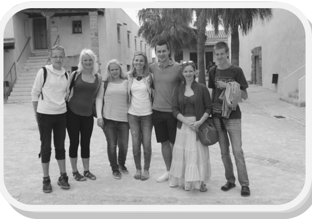
Saime kokku eestlasega (mees lühikestes pükstes)

erinevate loomade ja lindude kaitseala, mis asub mere ääres. Meile näidati mitmeid ohustatud liike ja hiljem saime kanuudega sõita, seeläbi saime üksteisega veel paremini tutvuda.