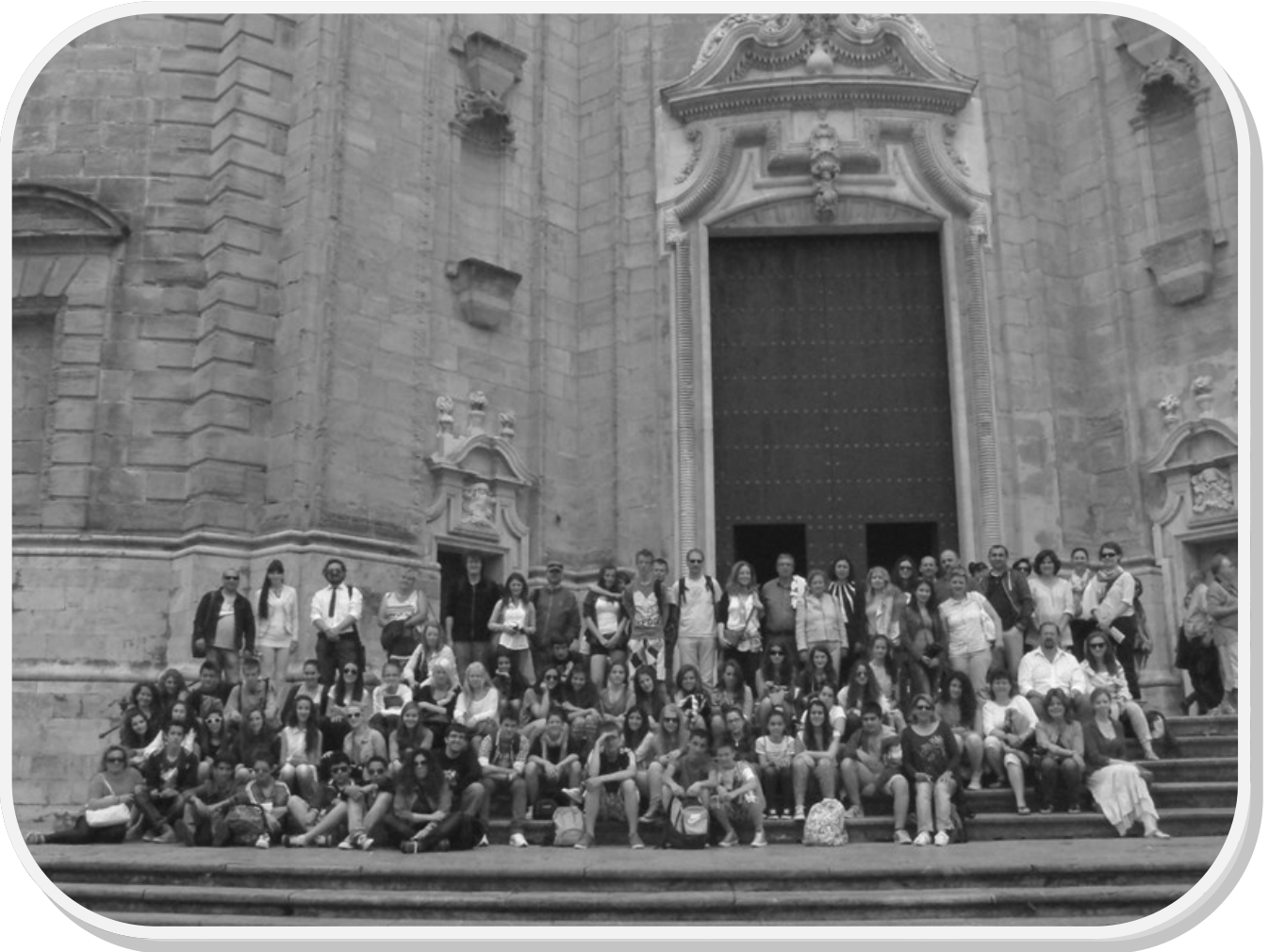
Kõik kohtumisel osalejad Cádiz katedraali ees