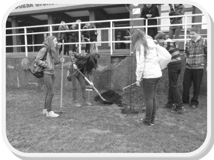
Eesti puu istutamine

mitu korda läbi laulnud, oli see lihtne.