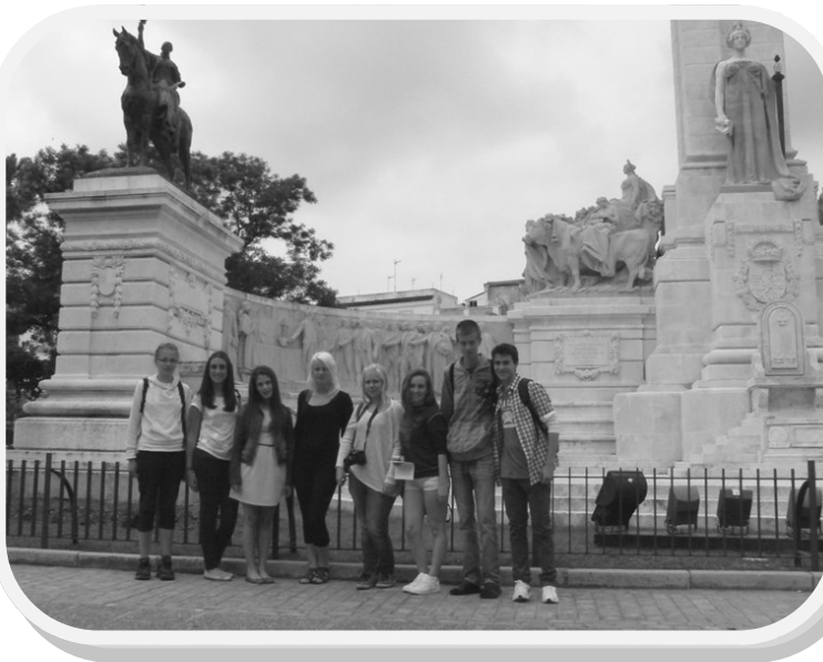
Meie oma võõrustajatega Cádizis Hispaania väljakul

erinevate loomade ja lindude kaitseala, mis asub mere ääres. Meile näidati mitmeid ohustatud liike ja hiljem saime kanuudega sõita, seeläbi saime üksteisega veel paremini tutvuda.