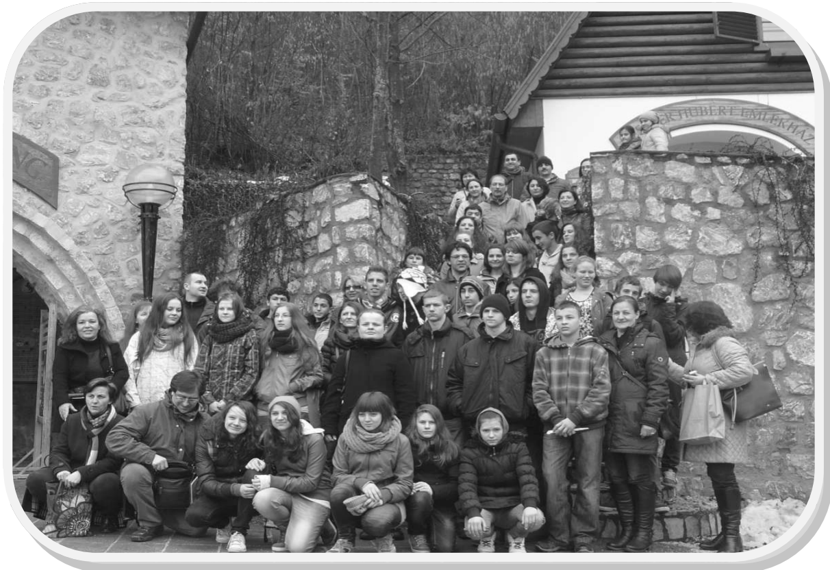
GEEP-projekti osalejad Aggteleki koobaste väljapääsu juures