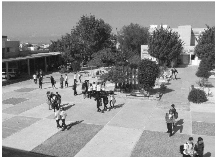
Apostolou Pavlou nimelise koolimaja hoovis.