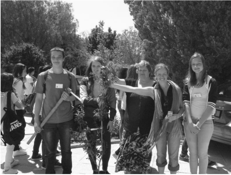
Eesti puu istutamine.