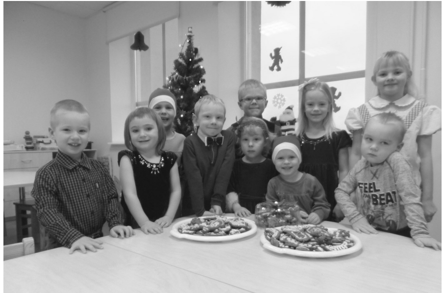
Lasteaialapsed enda valmistatud piparkookidega