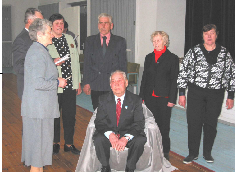
Palju aastaid erinevates ansambles ja koorides laulnud juubilar oma praeguste laulukaaslaste hulgas.